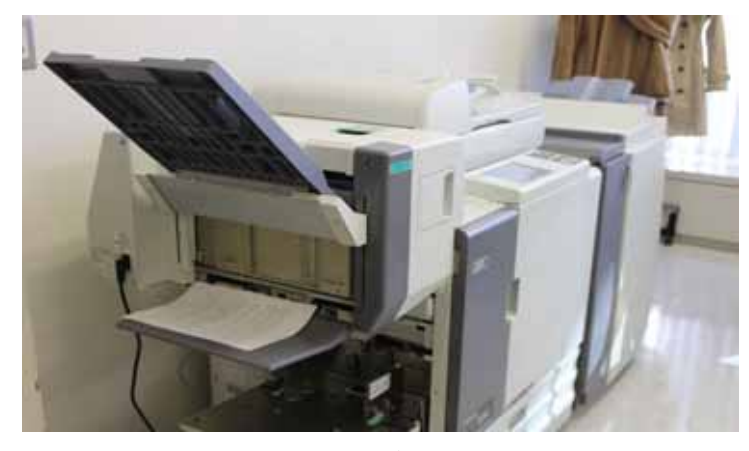
理想科学工業株式会社様より貸し出し協力いただいた「ORPHIS X シリーズ」